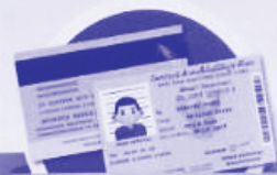
เอกสารอื่นที่รัฐบาลออกให้ (Other government issued identification document)