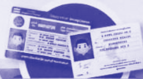
ใบขับขี่ / บัตรข้าราชการ (Driver's license / Government official's identification card)