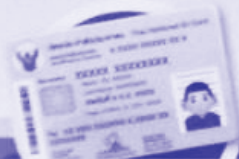
บัตรประชาชน (Identification card)