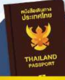
พาสปอร์ต (Passport)