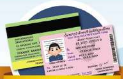
เอกสารอื่นที่รัฐบาลออกให้ (Other government issued identification document)