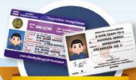
ใบขับขี่ / บัตรข้าราชการ (Driver's license / Government official's identification card)